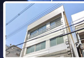
第1営業所 (日本/大阪) 幸成ビル