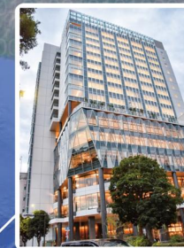
第2営業所 (日本/神奈川) 関内キャンパス4F